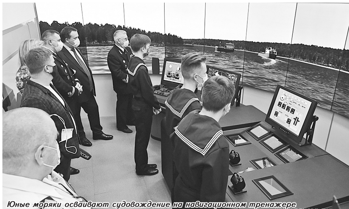
Юные моряки осваивают судовождение на навигационном тренажере

Мария КЛАПАТНЮК.