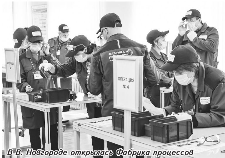
В В. Новгороде открылась Фабрика процессов